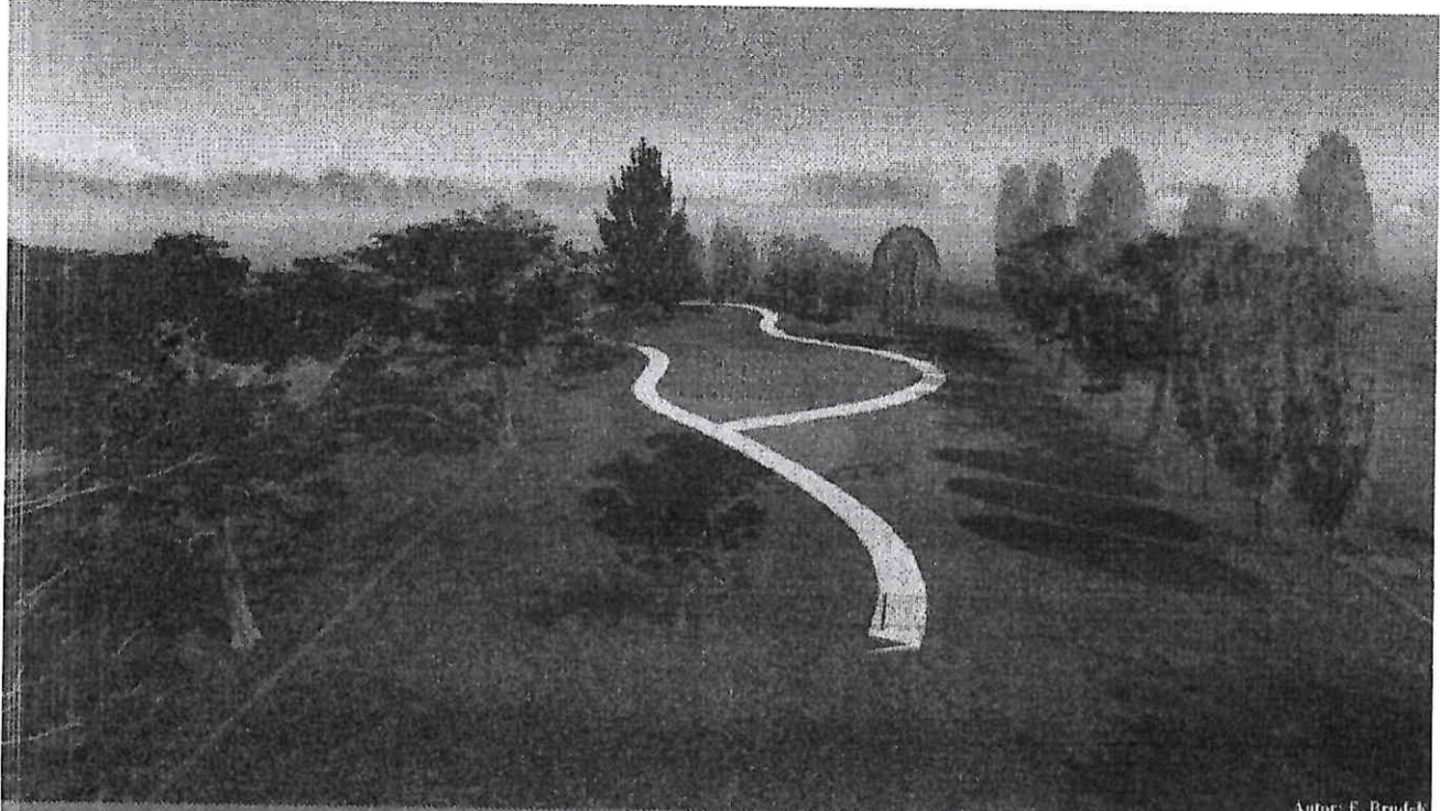
Autor: E. Brück