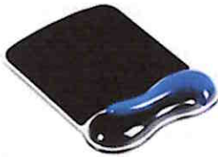
Zdjęcie poglądowe podkładki pod mysz i nadgarstek