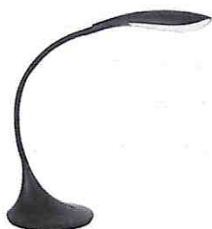
Zdjęcie poglądowe lampki biurowej