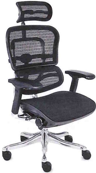
Zdjęcie poglądowe krzesła biurowego