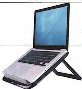
Zdjęcie poglądowe podstawy pod laptop