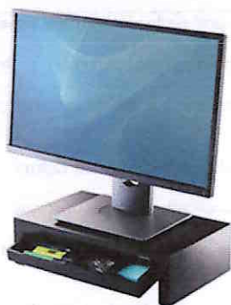
Zdjęcie poglądowe podstawy pod monitor