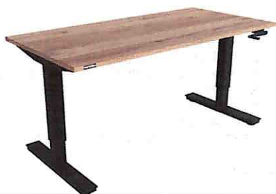
Zdjęcie poglądowe ergonomicznego biurka