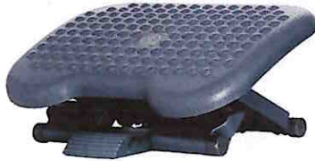
Zdjęcie poglądowe ergonomicznego podnóżka