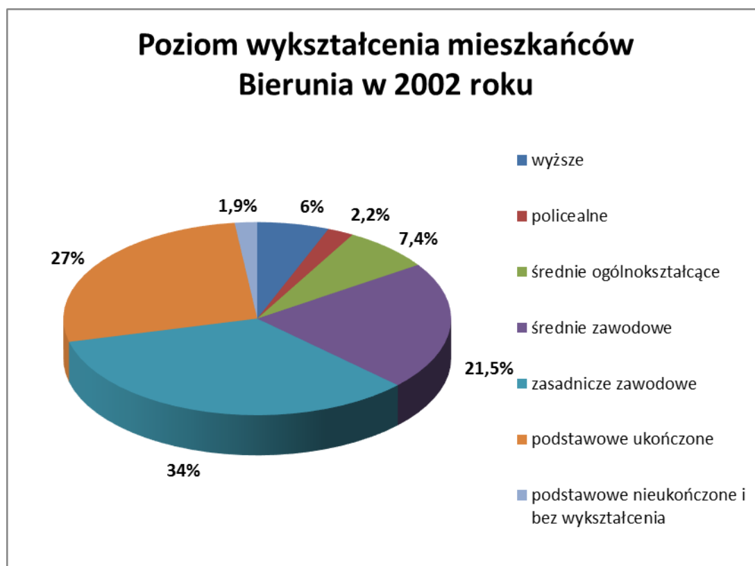
Wykres 4. Wykształcenie mieszkańców w Bieruniu w 2002 roku.