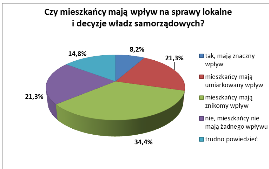
Wykres 2. Ocena działań wpływu mieszkańców na sprawy lokalne i decyzje władz samorządowych.