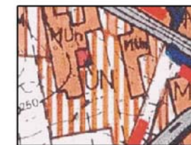
Wyrzys ze studium uwarunkowań i kierunków zagospodarowania przestrzennego miasta Biernie. skala 1:10 000

Rysunek zmiany planu, zał. nr 1. do Uchwały Nr. I/8/2013 Rady Miejskiej w Biernie z dnia 31 stycznia 2013r.