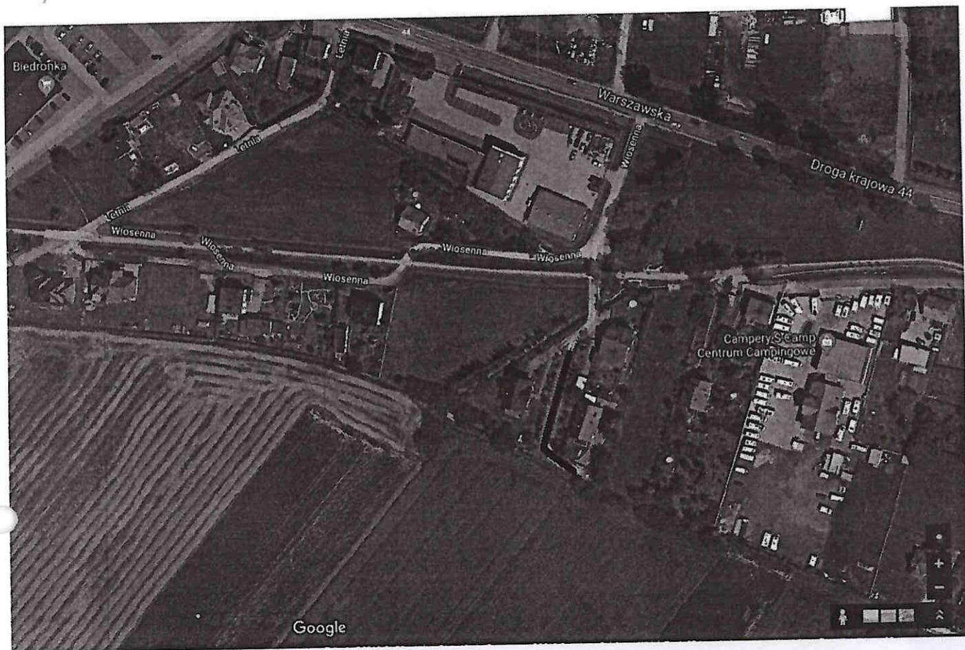
1. Aktualnie wytypowany do remontu odcinek