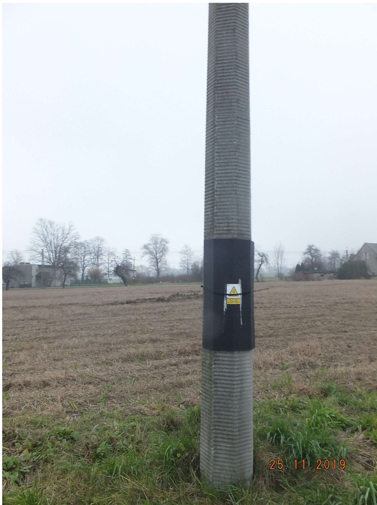
RYСУNEK 1 SŁUP ŻELBETOWY PRZY ULICY TATARAKOWEJ