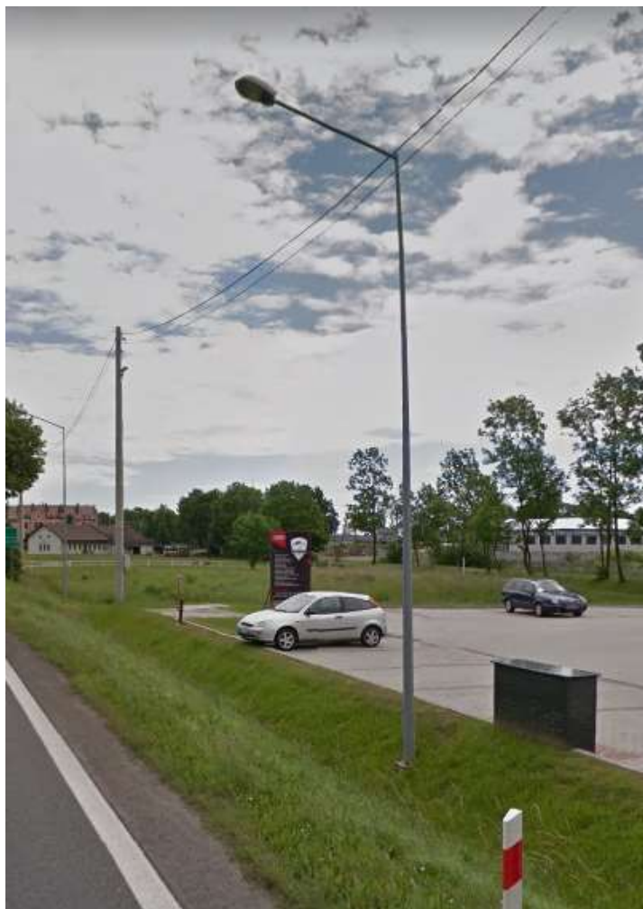
RYSUNEK 1 SŁUP STALOWY PRZY ULICY WARSZAWSKIEJ