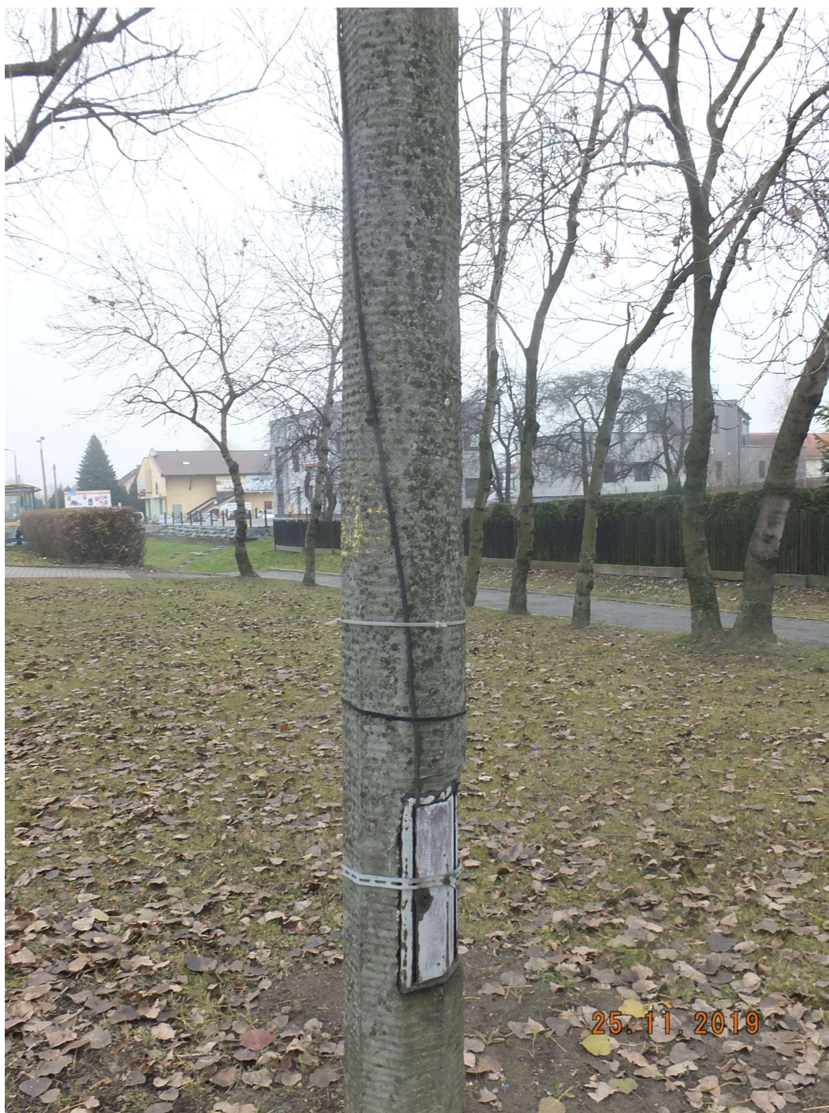
RYСУNEK 1 SŁUP ŻELBETOWY PRZY ULICY WARSZAWSKIEJ