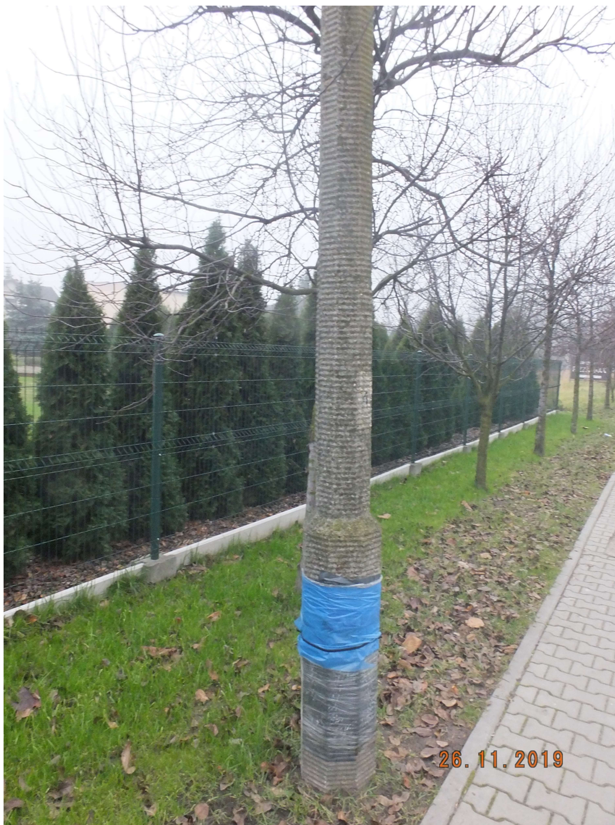
RYSUNEK 1 SŁUP ŻELBETOWY PRZY ULICY CHEMIKÓW