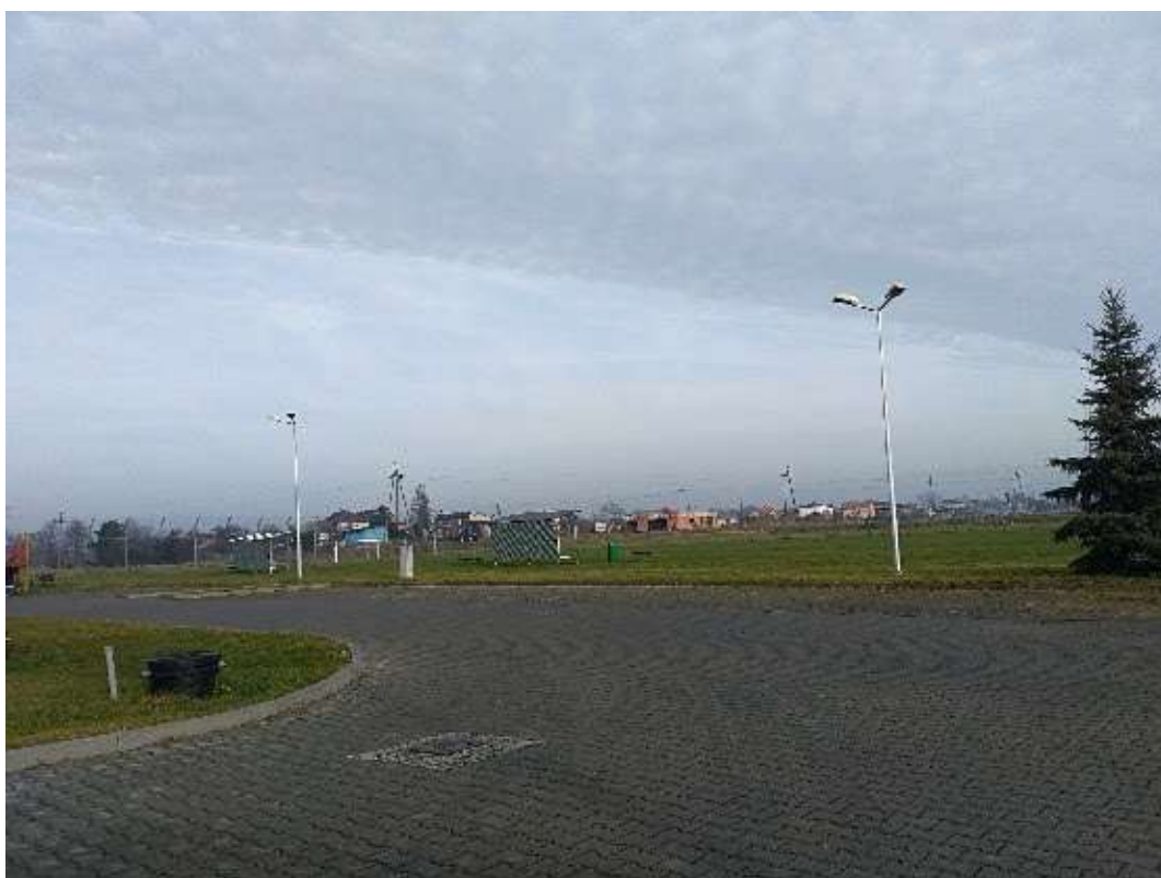
RYСУNEK 1 SŁUP ŻELBETOWY PRZY OSP CZARNUCHOWICE

Wszystkie zinwentaryzowane oprawy posiadają sodowe źródło światła.