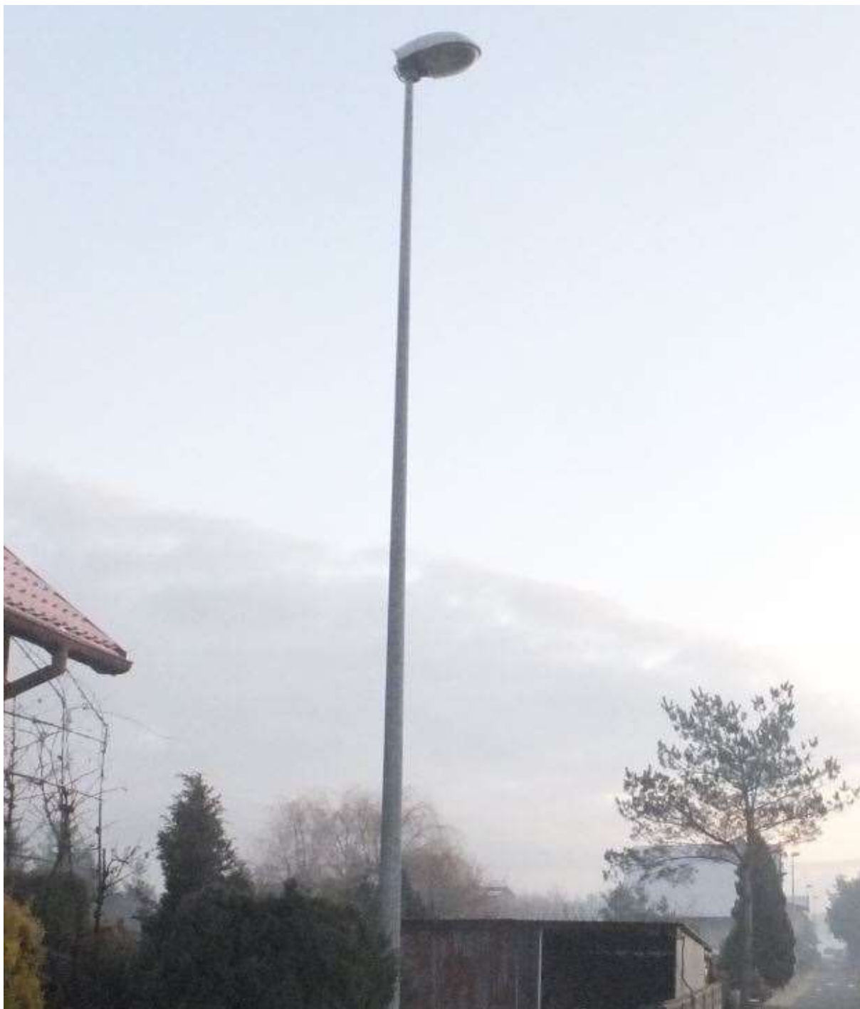
RYSUNEK 1 SŁUP OŚWIETLENIOWY PRZY ULICY SKOWRONKÓW