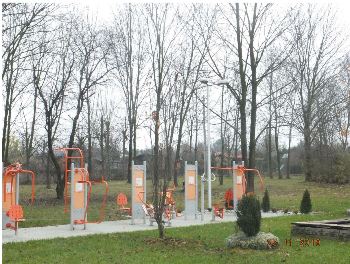
RYSUNEK 1 SŁUP OŚWIETLENIOWY PRZY ULICY KAMIENNEJ