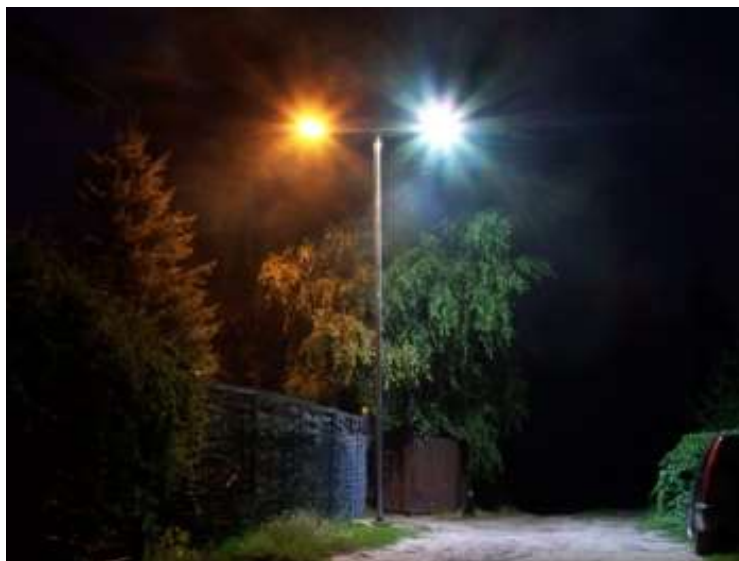
RYSUNEK 3 FOTOGRAFIA PRZEDSTAWIAJĄCA OŚWIETLENIE ŹRÓDŁEM SODOWYM (LEWA STRONA, MOC 75 W) I OŚWIETLeniem TYPU LED (PRAWA STRONA, MOC 30W),

Porównanie tych dwóch głównych technologii pokazuje w rzeczywistości fotografia zamieszczona poniżej