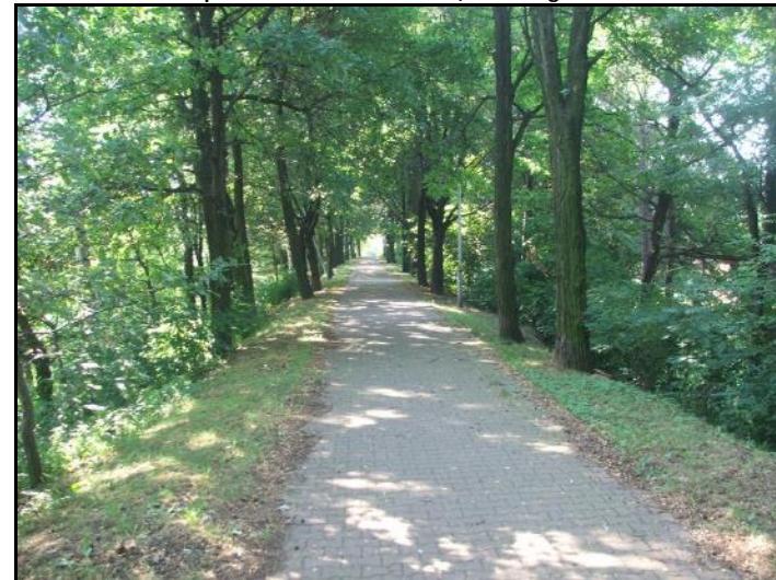
Fot. 8 Grobla Wielkiego Stawu Bieruńskiego