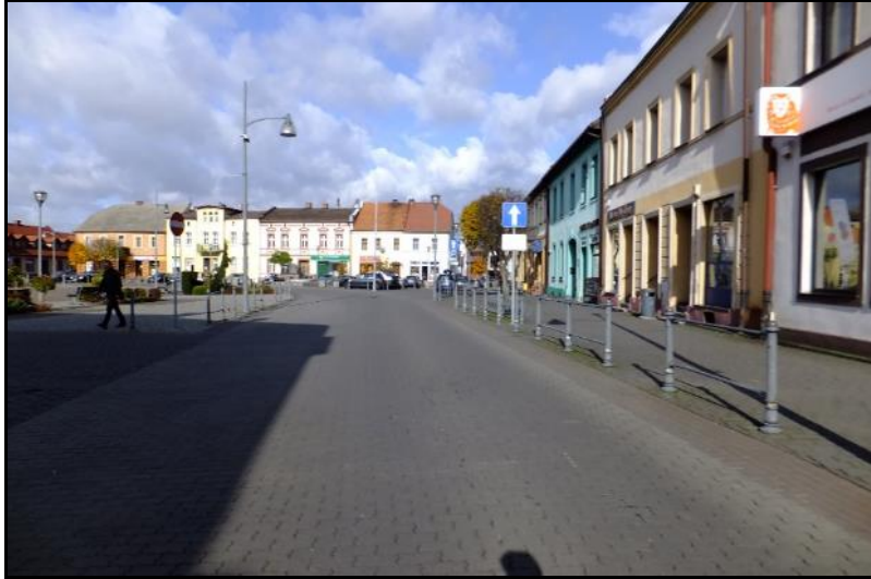
Fot. 1 Centralna część obszaru, Rynek