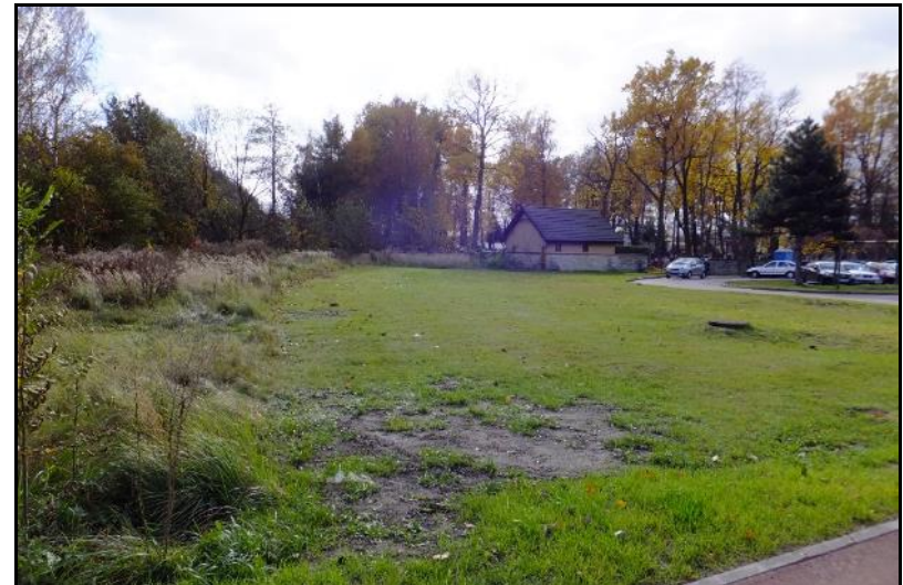
Fot. 4 Widok na cmentarz z ul. Chemików