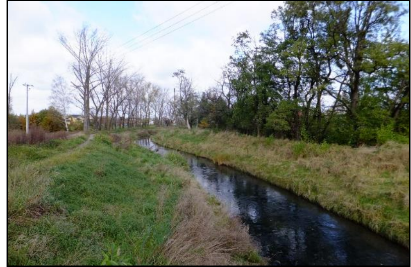
Fot. 3 Rzeka Mleczna