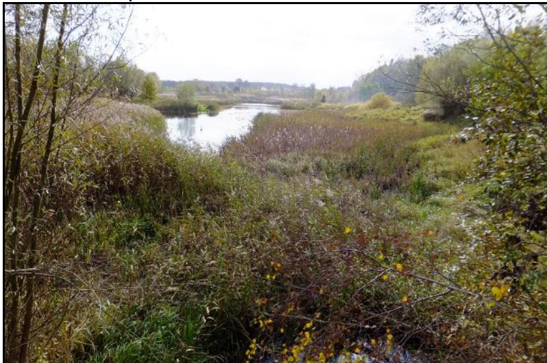
Fot. 6 Zalewiska na południe od ul. Chemików