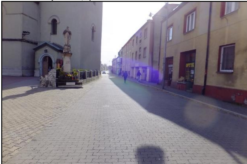
Fot. 2 Centralna część obszaru, zabudowa przy ul. Krakowskiej