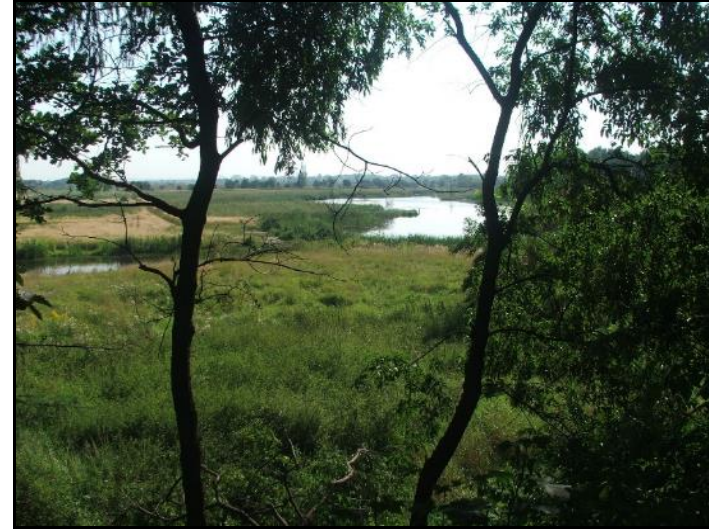
Fot. 7 Zalewiska na południe od ul. Chemików, widok z grobli