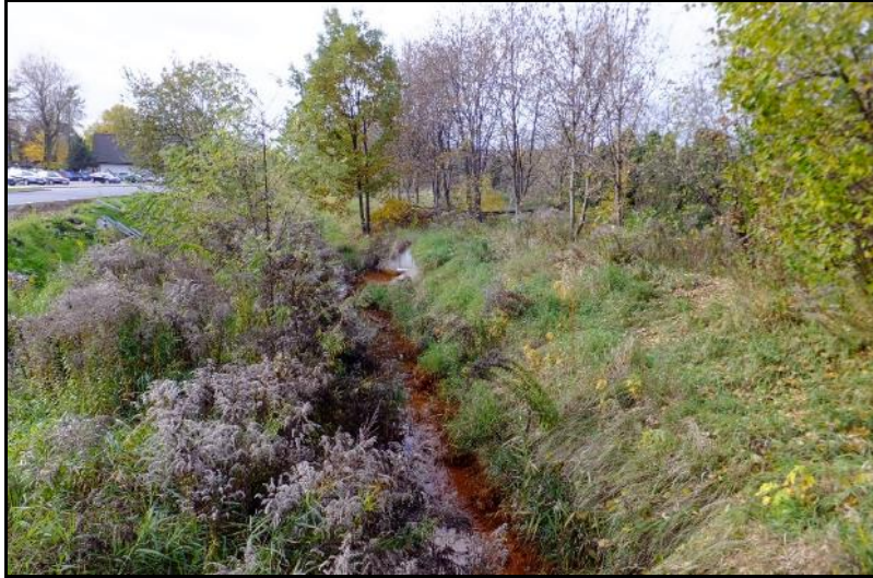
Fot. 5 Potok Stawowy