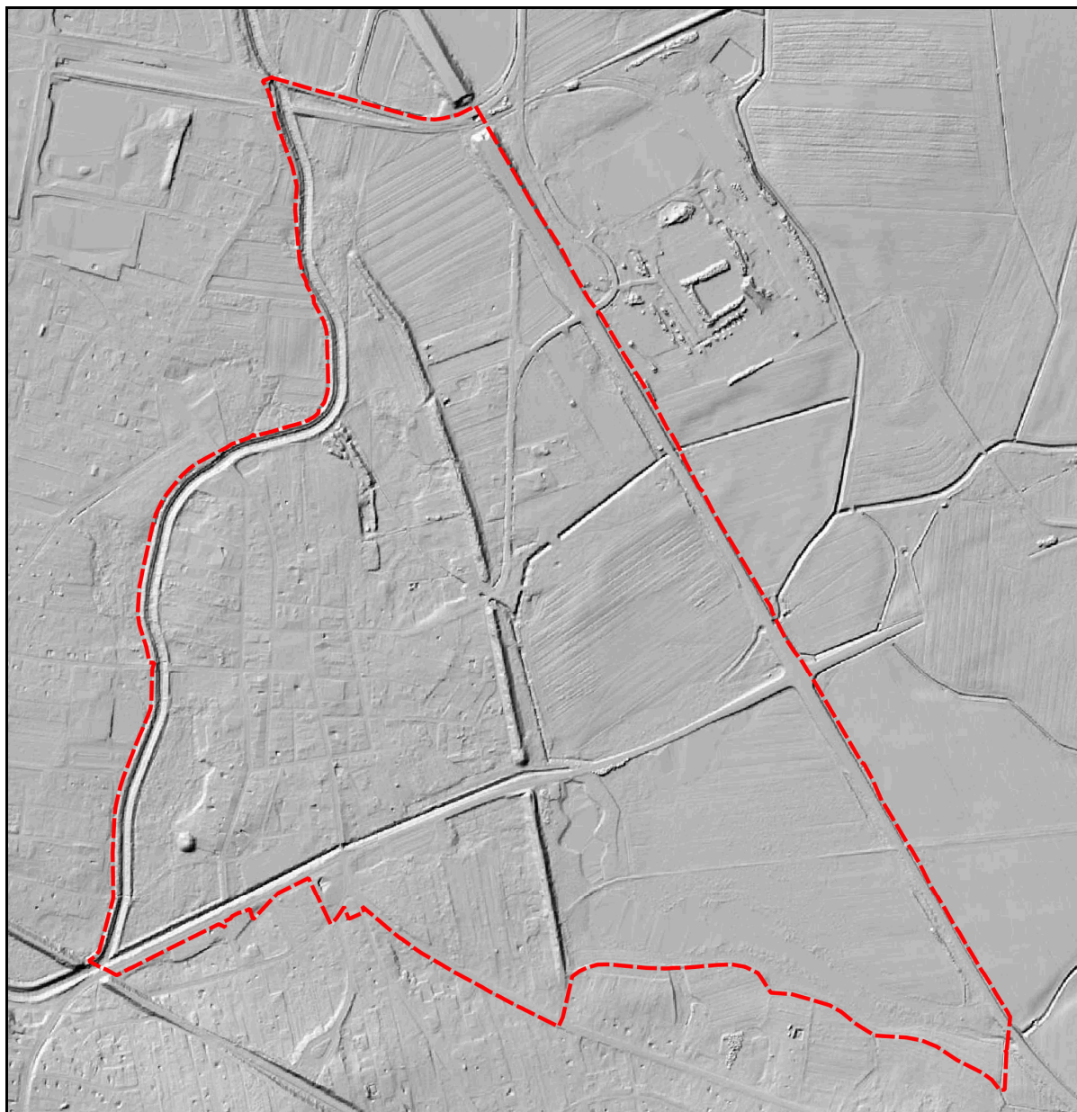
Rysunek 1 Ukształtowanie analizowanego terenu na podstawie Numerycznego Model Terenu.